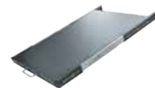
Полка выкатная высотой один юнит