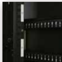
Вертикальная шкала в юнитах