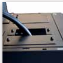
Верхние кабельные вводы с заглушками