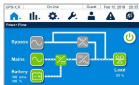
Benutzerfreundliches 5 Zoll Farb-Touchdisplay

Alle Angaben können ohne vorherige Ankündigung geändert werden.