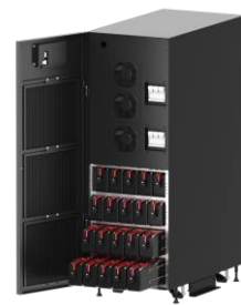
Modelle mit Batterie haben einfach austauschbare Batterieeinschübe