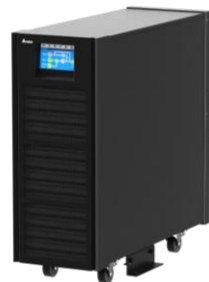
Optionale IP42 Lösung