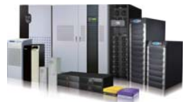
台達電子全系列從 600VA到4000 VA的不間斷電源系統產品, 提供最完整的電源保護, 成為客戶競爭力的最佳後盾