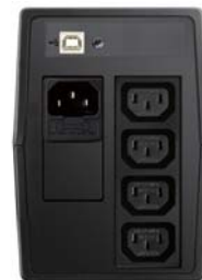
Model o mocy 600 VA – widok z tyłu

Specyfikacja techniczna może ulec zmianie w dowolnym momencie bez wcześniejszego powiadomienia.