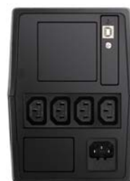
Model o mocy 1000 VA – widok z tyłu