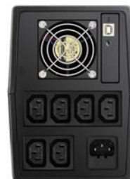
Model o mocy 1500 VA – widok z tyłu