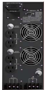
2/3 kVA Vista posterior