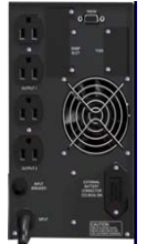
1 kVA Vista posterior