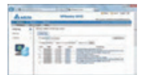
Advanced UPS Management Software - UPSentry