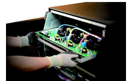
Thiết kế quạt dự phòng tăng sự ổn định của hệ thống