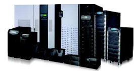
DELTA cung cấp đầy đủ các giải pháp UPS từ 600 VA đến 4000 KVA.