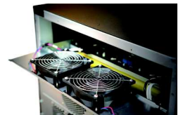
Thiết kế quạt dự phòng tăng sự ổn định của hệ thống