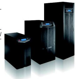
UPS hiệu suất cao